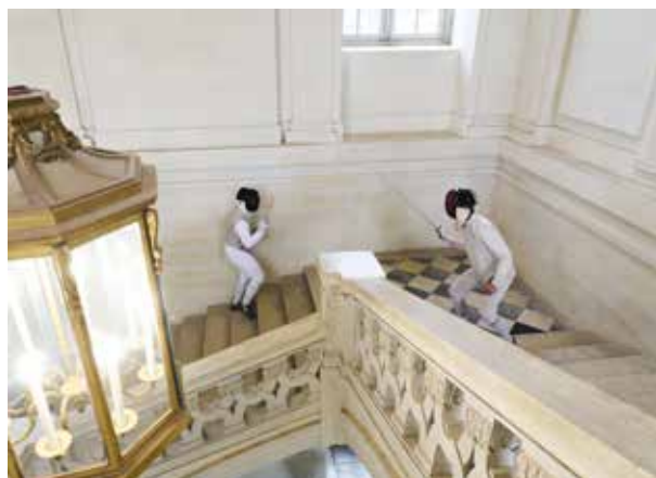
Démonstration d'escrime au château de Maisons