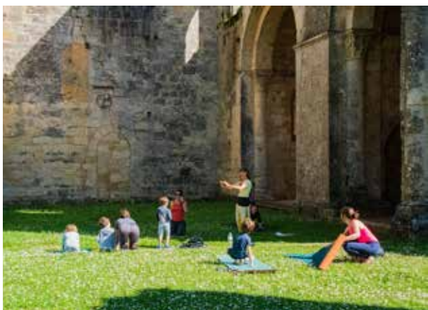
Yoga à l'abbaye de La Sauve-Majeure